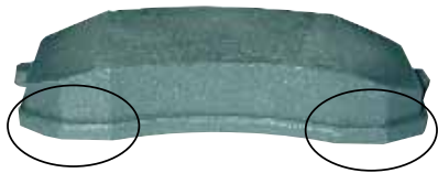
SCT: сколы на поверхности накладки

Единственным утешением послужило определение величины абсолютного и удельного износа. Последний составил 1,53 \text{ см}^3/10^6 \text{ кгм} .