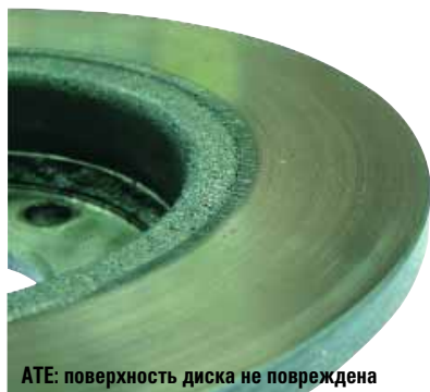
ATE: поверхность диска не повреждена

По результатам цикла восстановления рабочие характеристики не только не уменьшились, но даже несколько увеличились, что, с одной стороны, свидетельствует о некоторой «недопеченности». Но если оценивать результаты стендовых испыта-