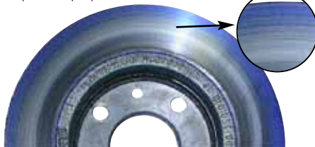
FINWHALE: побежалость диска

Визуальный осмотр дисков выявил наличие следов побежалости, что свидетельствует об их чрезмерном перегреве.