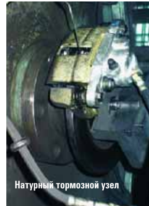
Натурный тормозной узел