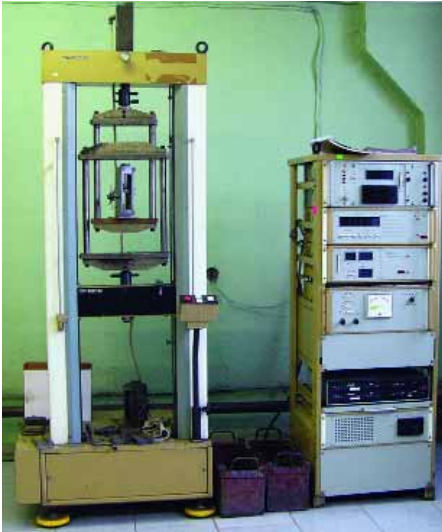
Стенд определения предела прочности соединения каркаса с колодкой

конвейере автозавода, а также поставляются на рынок запасных частей как оригинальные с маркой автопредприятия, так и в упаковке фирмы-изготовителя. В первом случае они будут несколько дороже из-за наличия торговой марки автопроизводителя, кроме того, предполагается, что автозавод проводит постоянный контроль качества.