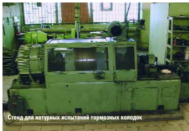
Стенд для натурных испытаний тормозных колодок

Первая категория — это колодки качества оригинального поставщика. Они полностью соответствуют требованиям производителя автомобилей и, как правило, используются при комплектации машин на