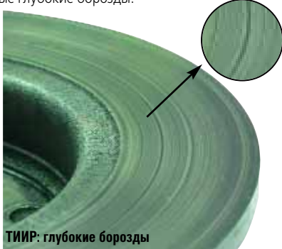
ТИИР: глубокие борозды

Про дискоберегающие свойства и вовсе не хочется говорить. На поверхности дисков с обеих сторон невооруженным взглядом видны многочисленные глубокие борозды.