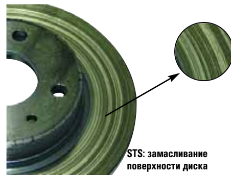
STS: замасливание поверхности диска

При визуальном осмотре диска каких-либо повреждений его поверхности замечено не было. Однако отчетливо видны смолянистые отложения, выделенные из материала накладки.